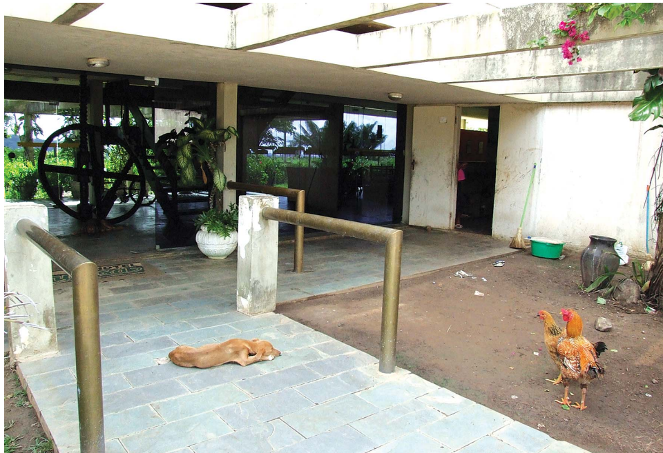
A equipe da PBTur constatou no Hotel Bruxaxá, em Areia, uma série de problemas estruturais, além de materiais e equipamentos abandonados

Ainda no Diário Oficial, a comissão organizadora do concurso informa que as justificativas de alteração dos gabaritos oficiais preliminares das provas objetivas, em razão das interposições de recursos feitas pelos candidatos, estarão disponíveis para consulta a partir do dia 24 de março de 2009, no endereço eletrônico www.cespe.unb.br/concursos/cehap_pb2008 .