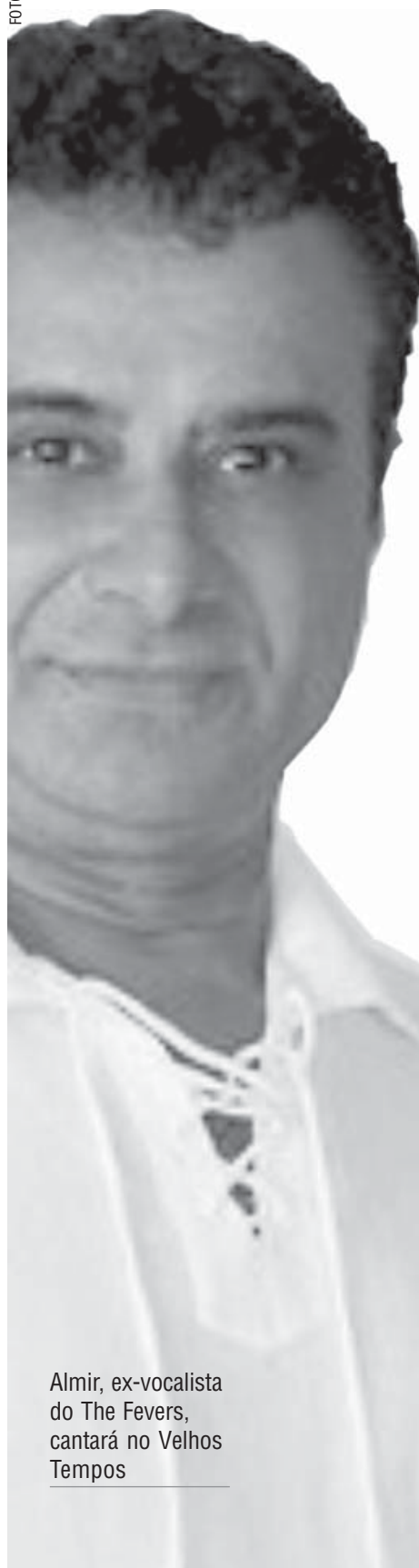
Almir, ex-vocalista do The Fevers, cantará no Velhos Tempos