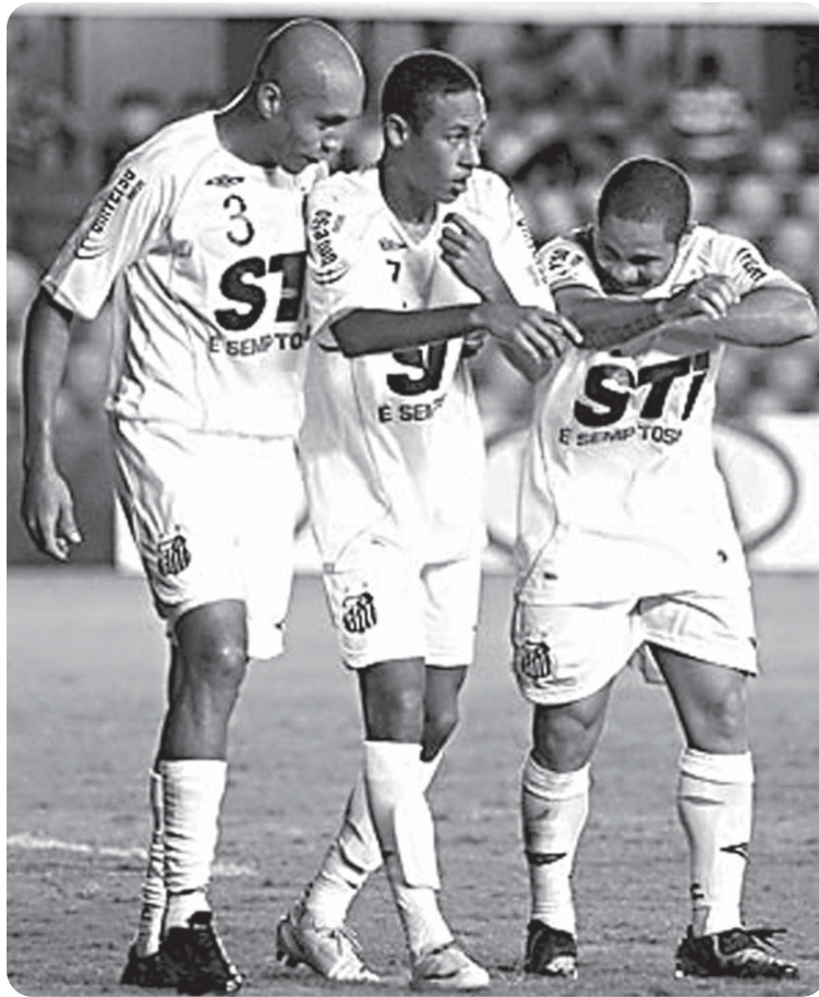
Neymar (C), a nova sensação santista, é outra atração no Pacaembu

A torcida do Corinthians é muito grande. Acho que vou ficar nervoso no começo, mas quando a bola rolar, tudo vai ficar mais tranquilo", encerra.