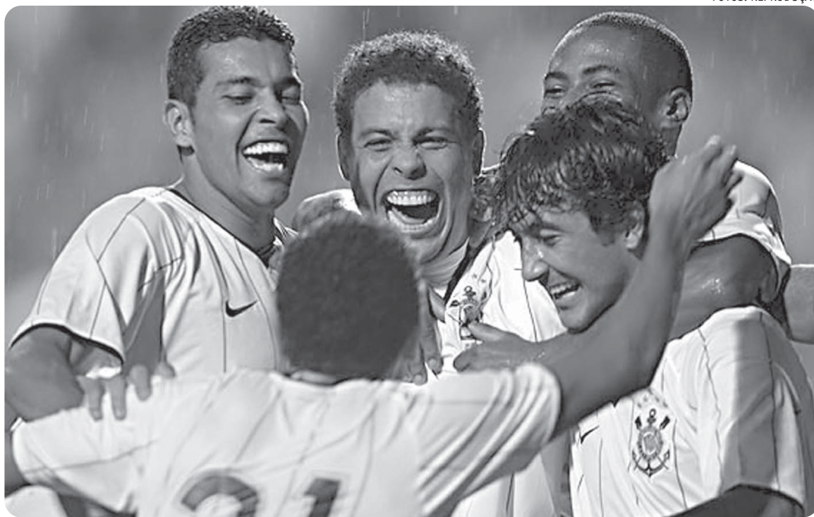
Ronaldo, comemorando gol com companheiros do Corinthians, é o principal nome do clássico contra o Santos

Eu quero descansar bastante para estar bem no clássico. Eu quero jogar. Não tenho