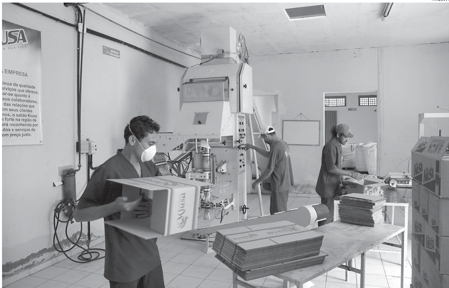
As micro, pequenas e médias empresas recebem o crédito no momento de crise internacional, em que a sua escassez tem "afetado de maneira mais aguda"

O presidente do BNDES lembrou que o empréstimo do BID não é a única fonte de recursos da instituição para as MPEs.