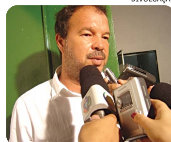
Simões ficou chateado com o comportamento dos jogadores

"Fiquei muito chateado quando soube disto, logo após a preleção que fiz com o elenco, momentos antes da partida, no Hotel Caiçara. Não procuro jogador, eles que me procuram. Quem não quiser ficar no bolo, a porta da rua é serventia da casa", desabafou o treinador logo após o apito final do árbitro Antônio Carlos Rocha, sa-