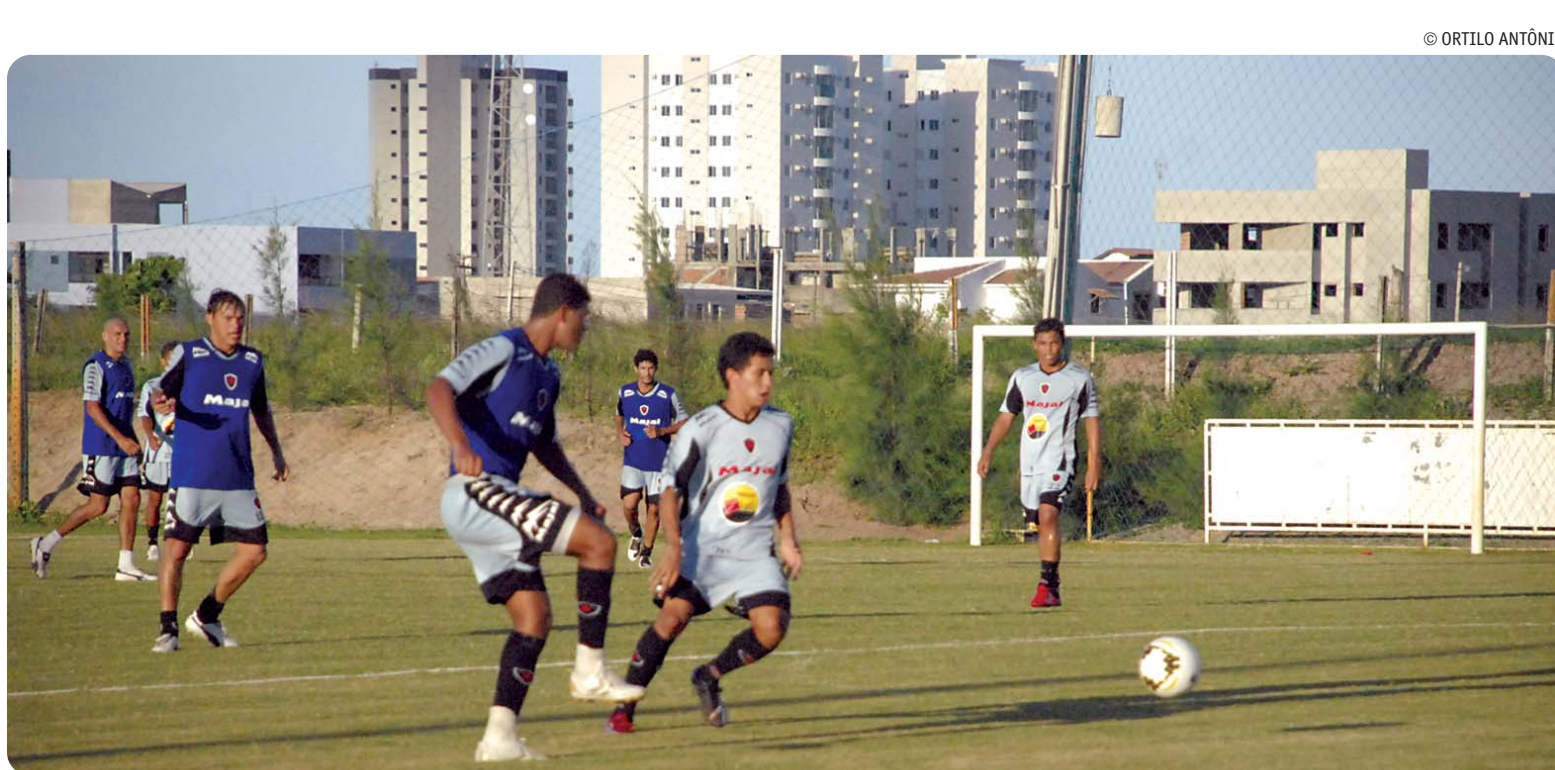
Sexta-feira (20), no campo da Oceânia, os jogadores do Botafogo voltaram a trabalhar já pensando no jogo de domingo contra o Internacional

Ambos com três pontos nesta fase inicial do segundo turno, Campinense x Queimadense brigam pela liderança da competição. Um dos times ficará pelo meio do caminho. O