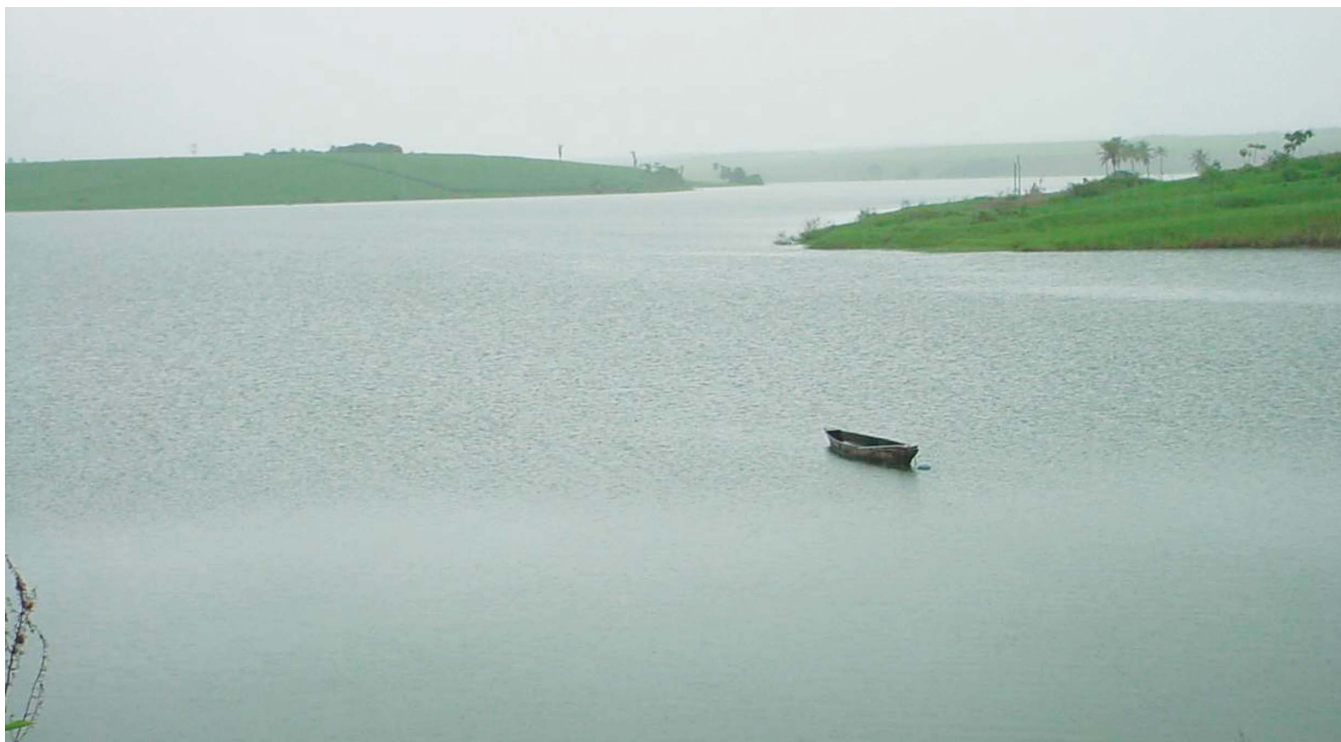
A água potável não está presente nos lares de 1,2 bilhão de pessoas, número que equivale a 35% da população mundial

A Secretaria de Estado da Saúde, por sua vez, promove e acompanha a vigilância da qualidade da água em sua área de competência, em articulação com o nível municipal e os responsáveis pelo controle de qualidade da água nos termos da legislação que regula o SUS; entre outras ações.