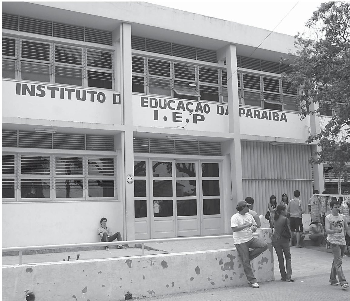
Escola Estadual Olivina Olívia, no Centro de João Pessoa, será um dos locais onde vão ser aplicadas as provas

De acordo com o edital publicado no Diário Oficial do Estado, as provas serão realizadas em cinquenta e sete endereços. Na Capital os candidatos farão as provas no Liceu Paraibano, Sesquicentenário, Olivina Olívia, Instituto de Educação da Paraíba, Escola