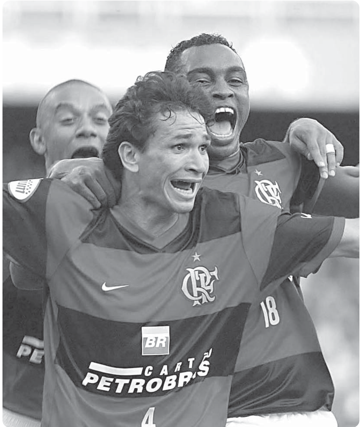
O zagueiro Ronaldo deve ser uma das novidades do Flamengo no jogo deste domingo contra o Vasco da Gama