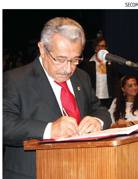
Projeto que cria CDES/PB foi assinado pelo governador José Maranhão

Em seu pronunciamento, após a assinatura do projeto de lei, o governador afirmou que a sociedade está sendo convidada a ter uma participação maior no Governo, que busca as formas democráticas de interagir com a população. Na entrevista à imprensa, ele afirmou que a finalidade do Conselho é ampliar as con-